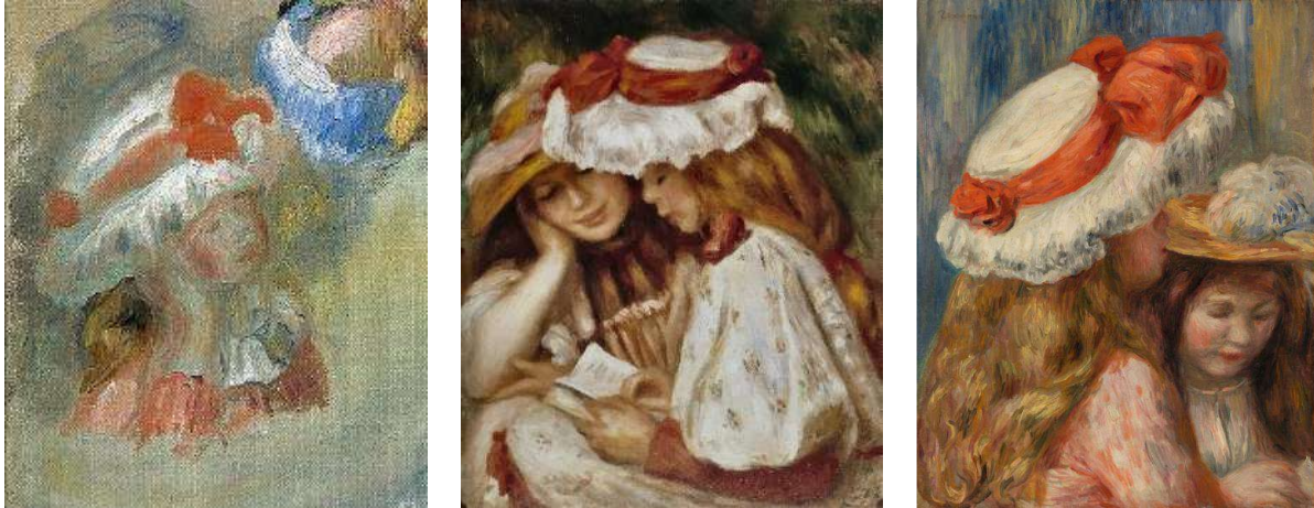
Renoir, Étude de nus couchés , détail, 1890-1893, Huile sur toile, Pont Saint-Esprit, musée d'Art sacré du Gard

Le motif de la Charlotte apparaît de manière régulière dans les œuvres de Pierre-Auguste Renoir. Cette coiffe figure sur dans l'Étude de nus couchés (n°2) : un détail représente en effet une petite fille dotée d'une charlotte à ruban rouge.