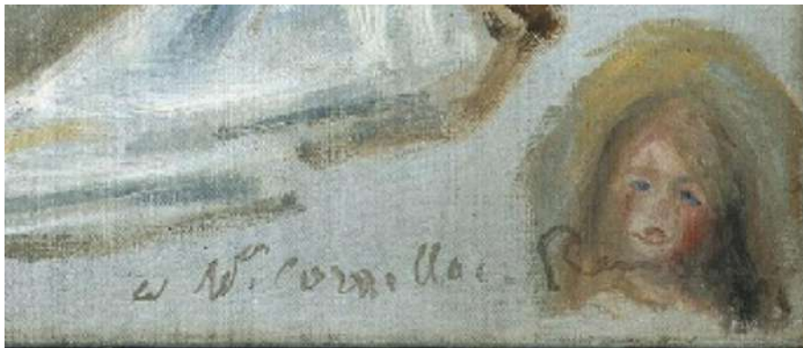
Renoir, Étude de nus couchés , détail, 1890-1893, Pont Saint-Esprit, musée d'Art sacré du Gard

Un autographe qui semble avoir été fait à la hâte mais qui témoigne des solides relations d'amitié entre Renoir et le couple.