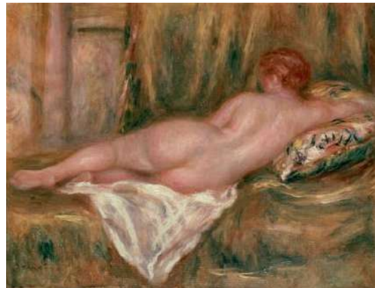
Vélasquez, Vénus à son miroir , Huile sur toile, 1647, Londres, National Gallery Renoir, Nu couché, vu de dos , vers 1916, Huile sur toile, Paris, Musée d'Orsay, © RMN-Grand Palais / Patrice Schmidt